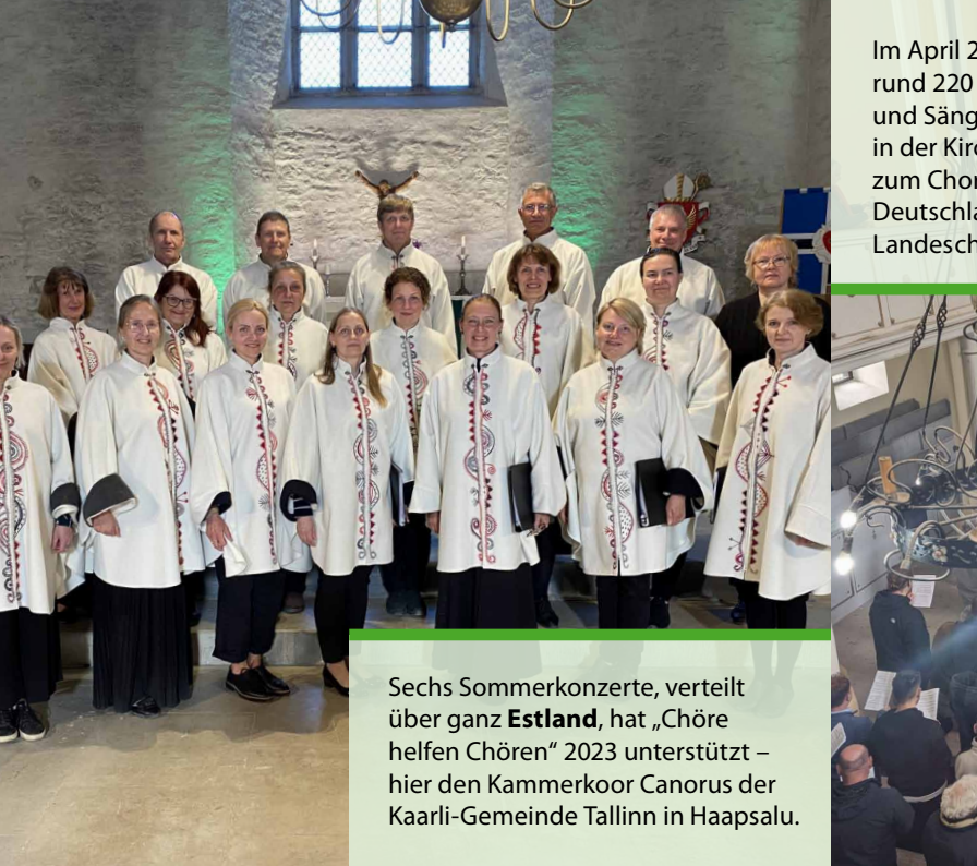
Sechs Sommerkonzerte, verteilt über ganz Estland , hat „Chöre helfen Chören“ 2023 unterstützt – hier den Kammerkoor Canorus der Kaarli-Gemeinde Tallinn in Haapsalu.

Spendenaktion für evangelische Chöre in Osteuropa