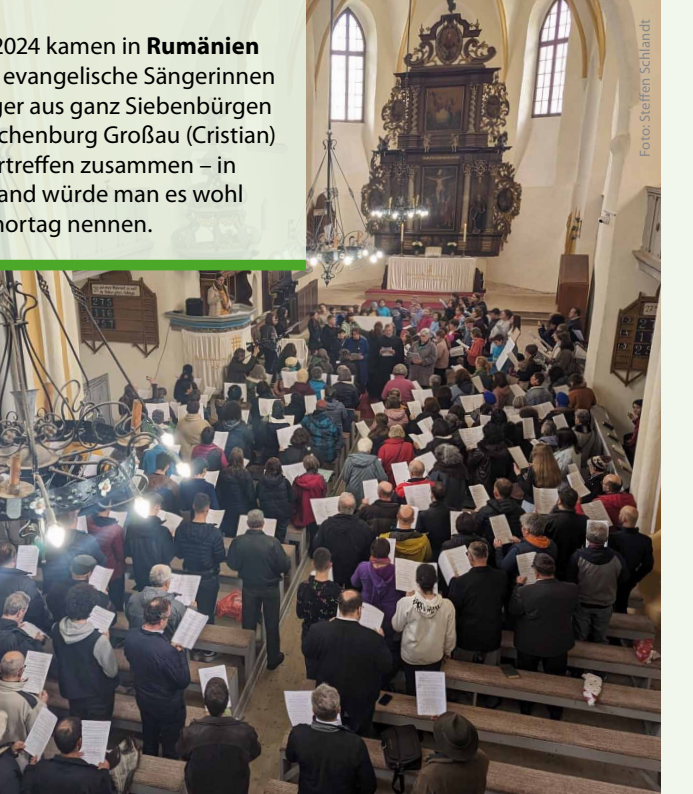
Im April 2024 kamen in Rumänien rund 220 evangelische Sängerinnen und Sänger aus ganz Siebenbürgen in der Kirchenburg Großau (Cristian) zum Chortreffen zusammen – in Deutschland würde man es wohl Landeschorntag nennen.